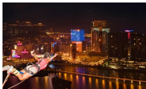
ナイトバンジージャンプもスリル満点