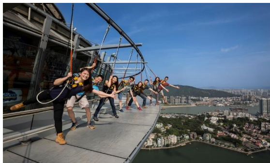
最大22名まで！チームビルディングにお勧め