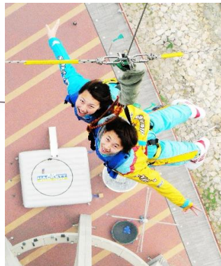
2人同時にジャンプ！