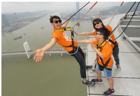
小さなお子さんも楽しめる

年齢制限無し(2才のお子様も経験あり。18才未満のお子様は保護者の同意書が必要)